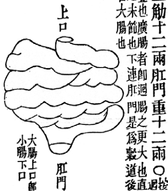
uit: Nei Ching, de oudste medische text geschreven door de Yellow Emperor (2696-2598 v. Chr.) Tekening van de dikke darm d.m.v. meditatie en observatie van de functie.

De functie van je dikke darm heeft te maken met transit (ontvangst en doorsturen); transformatie van de vloeistoffen uit je voedsel restanten en productie van vitamine K en eliminatie. Viatime K stimuleert de productie van protrombine in je lever, wat met je bloedstolling te maken heeft en is verder betrokken bij de synthese van een grote aantal eiwitten. Dikke darm functie wordt beschouwd als meer energetisch dan die van je long, want hij ondersteunt je long functie. Als de dikke darm energie zwak is, wordt het eliminatie proces verstoord, bv constipatie of diarree. Verder kunnen verstoringen in dikke darm energie stijfheid of zwakten in de polsen veroorzaken; pijn in je tandvlees creëren of je een verstopte neus geven.